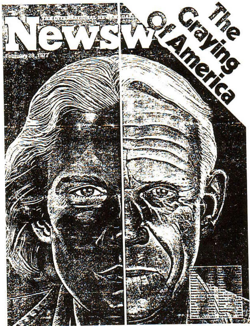
Titelbild der amerikanischen Zeitschrift Newsweek Magazine vom 28. 2. 1977